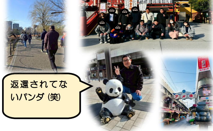
返還されてないパンダ(笑)

2月28日から3月1日にかけて、飲食部合同の一泊旅行が開催されました！ 東京上野に行き、現地の散策や食事会など、とても楽しい2日間となりました♪ 同じ店舗の仲間はもちろん、普段はなかなか会えない店舗の人と親睦を深めることが出来ました。 ぜひまた一緒にしましょう！